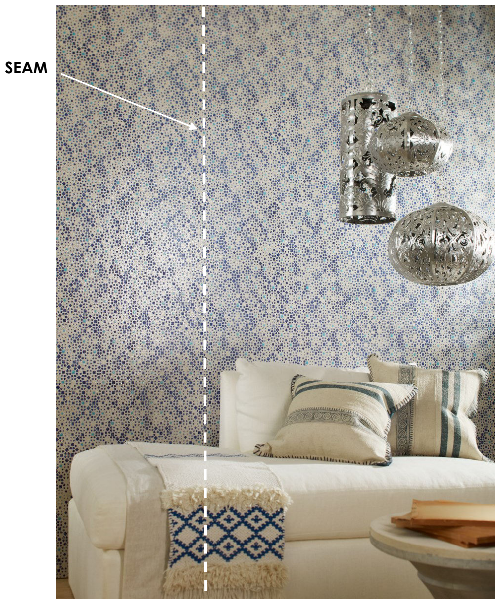
DIAGRAM B) SEAM