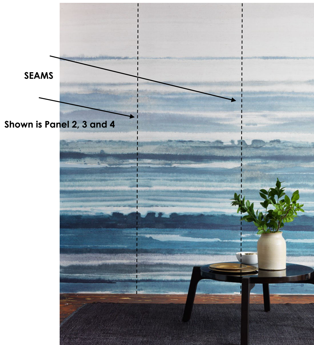
DIAGRAM C) SEAMS